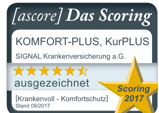
SIGNAL IDUNA Krankenversicherung a. G. – vormals SIGNAL Krankenversicherung a. G.